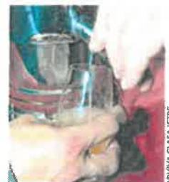
Ulaz je 10 eura za što se dobiva degustacijska čaša

Posjetitelji će moći kupiti degustacijsku čašu po cijeni od 10 eura te kušati vina po izboru, a za sve ostale ulaz bez čaše naplaćivat će se 3 eura. U suradnji s poznatim i