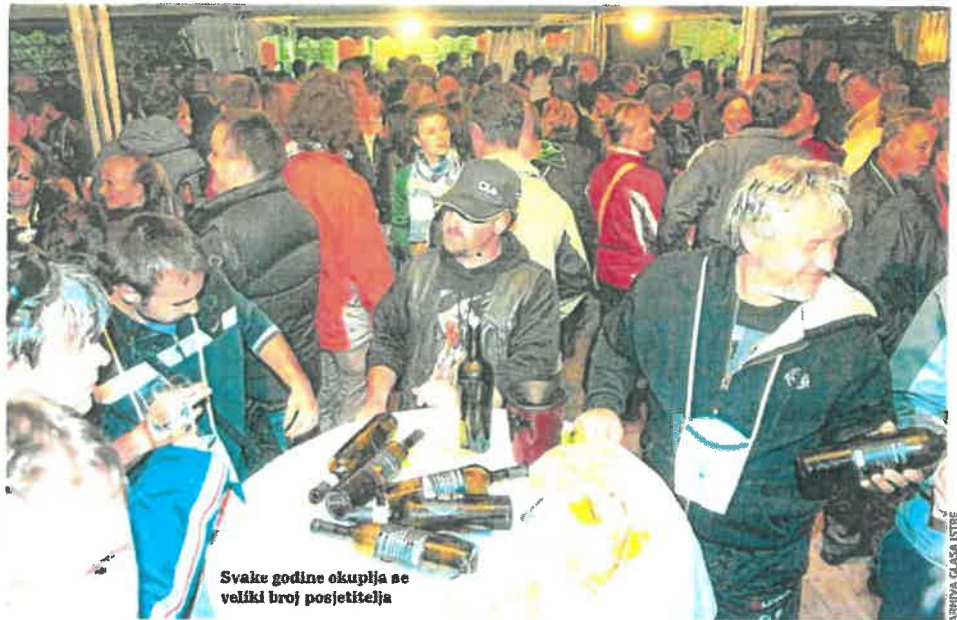
Svake godine okuplja se veliki broj posjetitelja