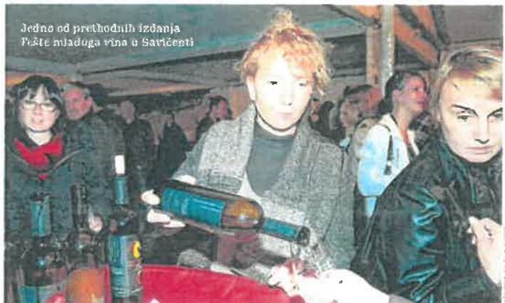
Jedno od prethodnih izdanja Fešte mladega vina u Svetvinčentu

U 13 sati kreće biciklijada s najdužom tradicijom u Istri. Prijave se primaju na dan biciklijade i to od 11.30 sati u Loži, a za prvih 50 prijavljenih osigurane su i majice biciklijade. Start biciklijade je na Placi, a vozi se dijelom šumom i asfaltno. Staza broji dva odmorišta na kojima su predviđena povremena zaustavljanja za okupljanje i okrijepu. Kotizacija će iznositi 10 eura, a za sve sudionike osiguran je ručak, dok se povratak biciklista