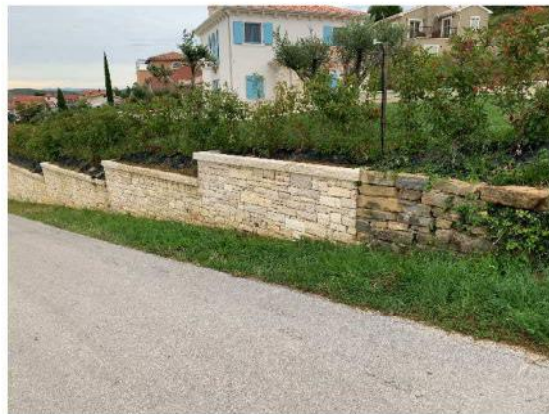
Suvremena izgradnja koje se nije uklopila u ambijent materijalima, pozicijom i formom