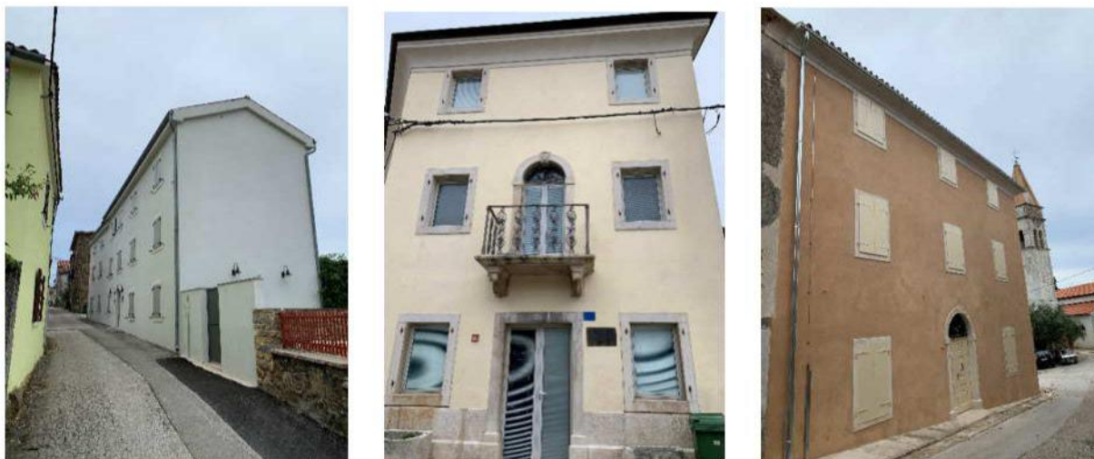
Primjeri kvalitetno obnovljenih objekata u Gorinjoj i Dolinaj Vasi

Obzirom da su objekti, barem za današnje standarde stanovanja relativno skromni, moguće je spojiti u tlocrtu dva ili više objekata da bi se dobio koristan prostor koji zadovoljava današnje standarde. U slučaju takve obnove moraju se zadržati vanjski volumeni objekata - ta specifična adicija volumena gdje se objekti naslanjaju jedan na drugi ali u izmaknutom tlocrtu, volumenu i visini predstavlja karakteristiku Istarskih naselja na uzvisinama. Volumeni objekata se dodiruju na jednoj strani ali nisu iste visine i/ili širine. Prilikom obnove ne preporučaju se dogradnje, nadogradnje i/ili prigradnje jer bi iste unificirale volumene i stvorile jedan veliki objekt povijesno neutemeljen i ambijentalno neusklađen. Osim baladura, kojeg ima manji dio kuća, pročelja objekata su plošna i lako čitljiva u svojoj funkcionalnosti. Baladur je moguće obnoviti jedino na objektima gdje je on zatečen u postojećem stanju.