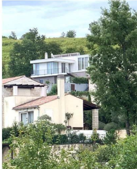
Primjeri suvremene arhitekture

Iz navedenog možemo zaključiti da jednostavnog "recepta" za kvalitetnu novu arhitekturu nema. Kvalitetna arhitektura zahtjeva mnogo faktora a prvenstveno su to razumijevanje ambijenta, materijala, načina i stilova života i gradnje datog podneblja.