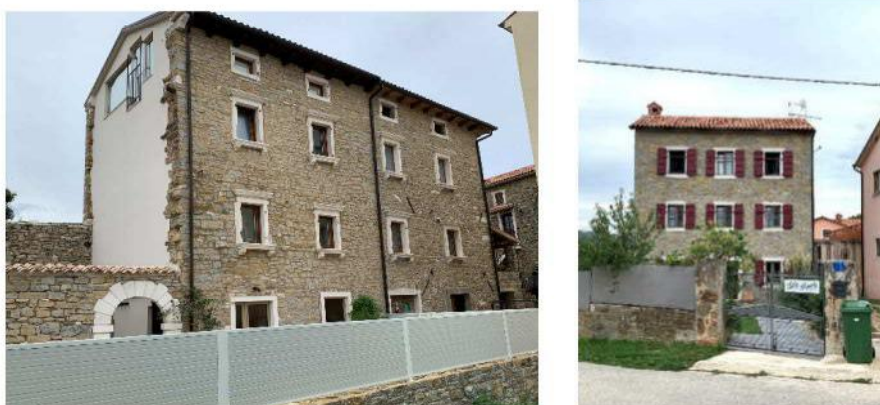
Primjeri neožbukanih fasada objekata – povijesno neutemeljeno i ambijentalno neuklopljeno

Nekada su sve kuće bile žbukane, nisu bile ožbukane jedino staje za životinje ali svi stambeni objekti su bili ožbukani; dakle cijelo naselje je bilo ožbukano. Današnja "moda" fugiranja kamena po pročeljima građevina je neispravna i povijesno neutemeljena. Sve bi fasade trebale biti ožbukane i to žbukom mineralnog sastava sa umiješanom bojom. Od boja se preporučaju zemljani i zagasiti tonovi, nijanse žute/okera a ukoliko se ide na neku jaču/dominantniju boju (plava, crvena ili sl.) onda koristiti zagasiti/izbljedjeli ton iste. U Momjanu je ta "moda" fugiranja kamena primijenjena na malom broju stambenih objekata ali je primijenjena u interijeru župne crkve gdje su zidovi fugirani što je neutemeljeno i degradira estetiku sakralnog prostora.