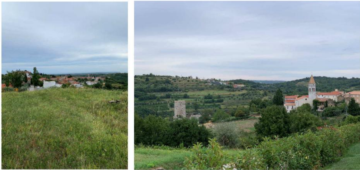
Vizure koje se moraju čuvati – ne dozvoliti spoj postojećeg naselja sa San Maurom i Kaštelom

Prilikom budućeg razmatranja urbanističke situacije Momjana smatramo da je najvažnije kvalitetno definirati mjesta na kojima je novogradnja moguća, a ta mjesta moraju biti na obodu povijesnog naselja i ne smiju dozvoliti spajanje Momjana i San Maura te Momjana i Kaštela Rota. Ukoliko su ta mjesta za novogradnju na nižim kotama to će izvornija ostati vizura na dva povijesna naselja – Gorinju i Dolinju Vas – koja čine Momjan. Nikako se ne smije desiti da se spoje naselja San Mauro i Momjan, te kaštel Rota i Momjan. Između njih mora postojati maksimalno velik neizgrađeni pojas, širok koliko datosti u prostoru to omogućuju. Uređenje šetnica, edukativnih staza, kultivacija i obnova terasa i sl. je poželjno, no elementi visokogradnje se tu ne bi smjeli pojaviti. Zadržati te dvije cezure u prostoru smatramo jednom od najvažnijih smjernica očuvanja povijesnog i kulturnog identiteta Momjana.