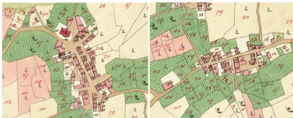
Dolinja Vas – povijesna jezgra naselja

Najlakše je propisati stroge smjernice (kojih se je u praksi gotovo nemoguće pridržavati) no to rezultira još većom depopulacijom i gubljenjem interesa za život u mjestu; što nikako nije bio cilj ove studije. Cilj je bio pronaći smjernice koje su povijesno i umjetnički utemeljene ali omogućuju relativno laganu primjenu. Na taj se način zadržava najvažniji resurs svakog mjesta – život.