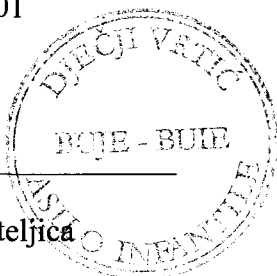
Loris Primožić, ravnateljica