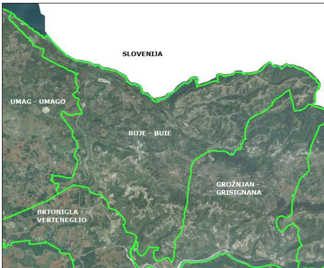
Slika 1. Prostorni smještaj Grada