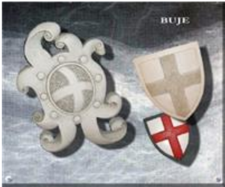
GRAD BUJE-BUIE, 2016.